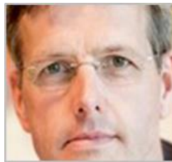
Peter Tjalma Communicatie